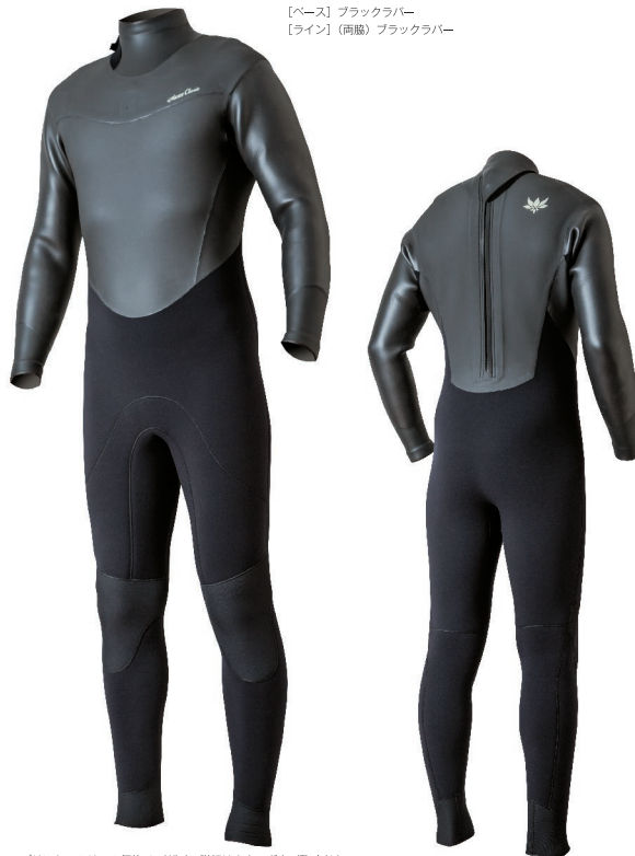
【ベース】ブラックラバー 【ライン】(両脇)ブラックラバー

この冬話題騒然!!バックジップ特有の優れた着脱のし易さとフラップドライに近い高度な水密機能の両方を兼ね備えた今までにないハイブリッドタイプのバックジップスーツADVANCED BACK ZIP。幾度となくテストを重ね細部にまで改良を重ねた『寒さ』に立ち向かう機能が快適な冬のサーフィンをお約束します。お得な特典が盛りだくさんこの機会にぜひ!