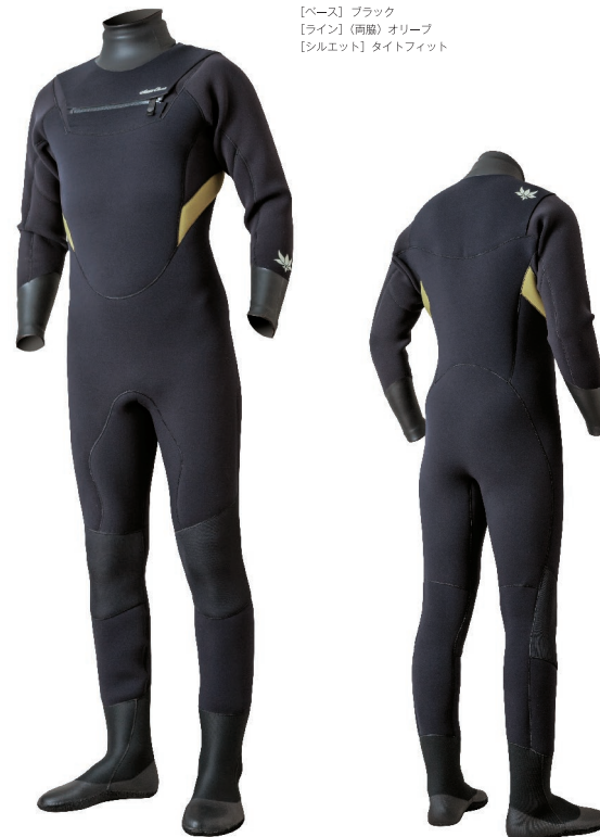
【ベース】ブラック 【ライン】(両脇)オリーフ 【シルエット】タイトフィット

昨シーズン終了前に完売するほどの人気を博し、東北/北海道などの極寒エリアでの確固たる実績と地位を築き上げたFLAP DRY。今冬は『着脱のし易さと更なるストレスフリー』をキーワードにテストを重ねストレスフリーを掲げるにふさわしい改良がなされアドバンスド フラップドライとしてブラッシュアップ。