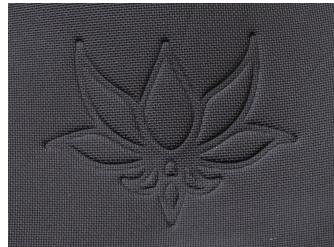
左胸 / 左背中のエンボス型押しロゴ (場所のご指定はお受けできません)