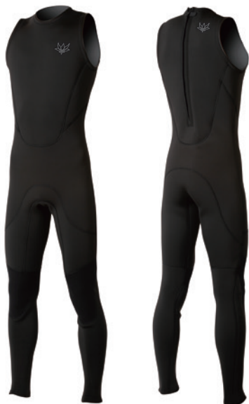
3mm ロングジョン ¥38,500(税込)