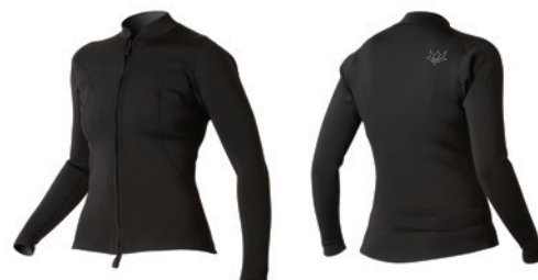
レディース 2mm ジャケット ¥25,300(税込)