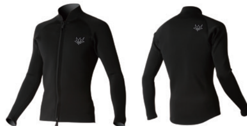
2mm ジャケット ¥25,300(税込)