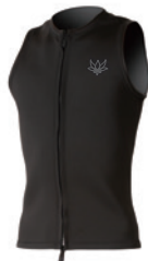
2mm ベスト ¥19,800(税込)