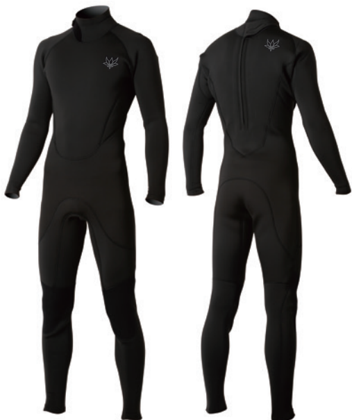
3mm フルスーツ ¥49,500(税込)