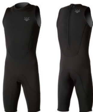
2mm ショートジョン ¥34,100(税込)