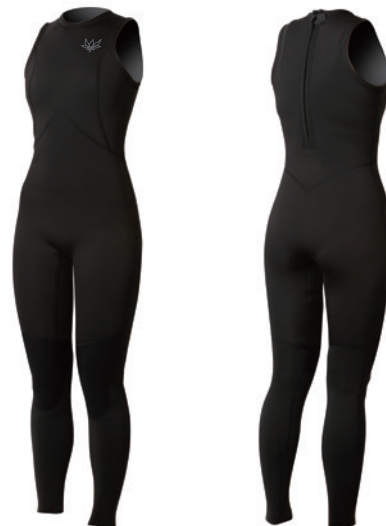
レディース 3mm ロングジョン ¥38,500(税込)