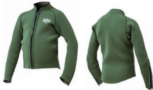
2mm長袖ジャケット [ベース] Re:Blue オリーブ