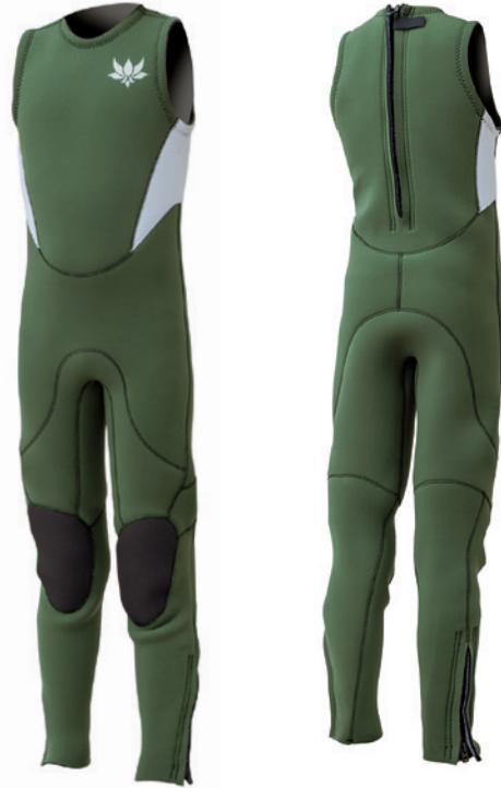
2mmロングジョン [ベース] Re:Blue オリーブ [ライン] (両脇)ホワイト