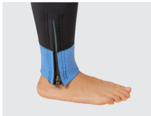
両足首には着脱をアシストするショートファスナーが標準装備